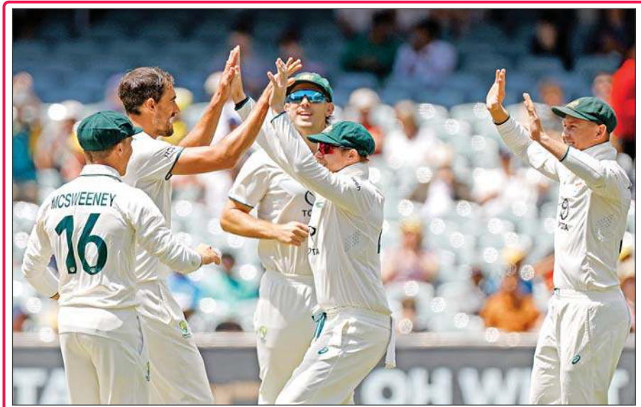
ਰਿਸ਼ਭ ਪੰਤ ਨੂੰ ਆਊਟ ਕਰਨ ਤੋਂ ਬਾਅਦ ਖੁਸ਼ੀ ਮਨਾਉਂਦੇ ਹੋਏ ਆਸਟ੍ਰੇਲੀਆ ਦੇ ਖਿਡਾਰੀ