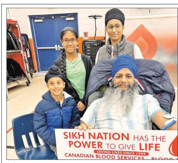
● ਸਿੱਖ ਨੇਸ਼ਨ ਸੰਸਥਾ ਵਲੋਂ 1984 ਦੀ ਸਿੱਖ ਨਸਲਕੁਸ਼ੀ ਦੀ ਯਾਦ 'ਚ ਲਗਾਏ ਕੈਂਪ 'ਚ ਖ਼ੁਨਦਾਨ ਕਰਦਾ ਹੋਇਆ ਇਕ ਸਿੱਖ।

ਟੋਰਾਂਟੋ, 8 ਦਸੰਬਰ (ਹਰਜੀਤ ਸਿੰਘ ਬਾਜਵਾ)-ਸਿੱਖ ਨੇਸ਼ਨ ਸੰਸਥਾ ਵਲੋਂ ਨਵੰਬਰ 1984 ਦੀ ਸਿੱਖ ਨਸਲਕੁਸ਼ੀ ਦੀ ਯਾਦ 'ਚ ਇਥੇ ਅਲੱਗ-ਅਲੱਗ ਥਾਵਾਂ 'ਤੇ ਖ਼ੁਨਦਾਨ ਕੈਂਪ ਲਾਏ ਗਏ। ਸੰਸਥਾ ਦੇ ਮੈਂਬਰਾਂ ਦਾ ਕਹਿਣਾ ਸੀ ਕਿ ਇਹ ਖ਼ੁਨਦਾਨ ਕੈਂਪ ਸੈਂਕੜੇ ਲੋਕਾਂ ਦੀ ਜ਼ਿੰਦਗੀ ਬਚਾਉਣ ਲਈ ਸਹਾਈ ਸਿੱਧ ਹੁੰਦੇ ਹਨ। ਉਨ੍ਹਾਂ ਦਾ ਹੋਰ ਵੀ ਕਹਿਣਾ ਹੈ ਕਿ ਸਿੱਖ ਨੇਸ਼ਨ ਦੀ ਪੂਰੇ ਕੈਨੇਡਾ 'ਚ ਖ਼ੁਨਦਾਨ ਰਾਹੀਂ ਸਭ ਤੋਂ ਵੱਧ ਜਾਨਾਂ ਬਚਾਉਣ ਵਾਲੀ ਇਹ ਮੁਹਿੰਮ ਹੈ ਜੋ ਕਿ ਪੂਰੇ ਕੈਨੇਡਾ 'ਚ ਲੱਭਣਵਾਂ ਲਈ ਖ਼ੁਨ ਦਾ ਪ੍ਰਬੰਧ ਕਰਦੀ ਹੈ ਜਿਸਦੇ ਹਰ ਸਾਲ ਪੂਰੇ ਕੈਨੇਡਾ ਭਰ 'ਚ 30 ਦੇ ਕਰੀਬ ਕੈਂਪ ਲਗਦੇ ਹਨ, ਸੰਸਥਾ ਵਲੋਂ ਸਾਰੇ ਵਲੰਟੀਅਰਾਂ ਤੇ ਸਹਿਯੋਗੀਆਂ ਦਾ ਇਸ ਮੁਹਿੰਮ ਲਈ ਪੂਰਨ ਸਹਿਯੋਗ ਦੇਣ 'ਤੇ ਨਿਰਵਾਣ ਵੀ ਕੀਤਾ ਗਿਆ।