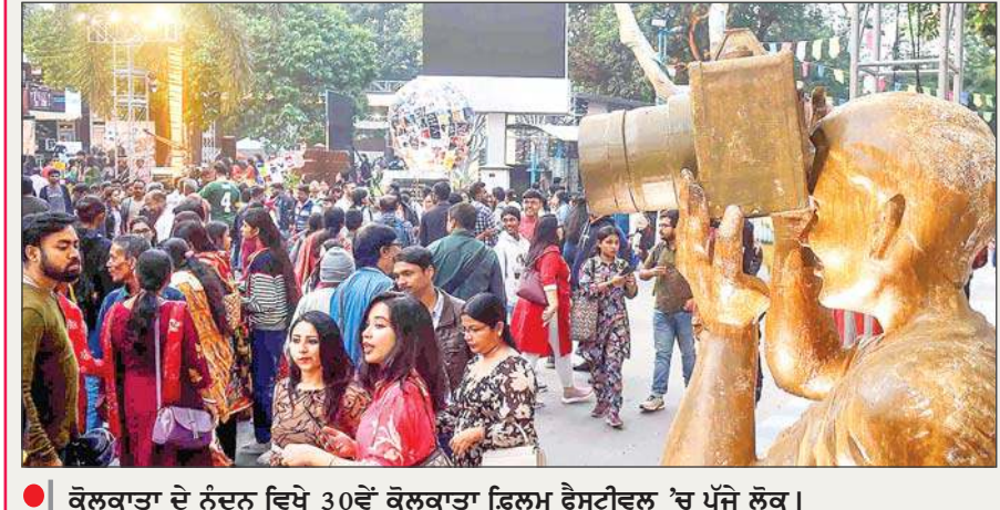
● ਕੋਲਕਾਤਾ ਦੇ ਨੰਦਨ ਵਿਖੇ 30ਵੇਂ ਕੋਲਕਾਤਾ ਫਿਲਮ ਫੈਸਟੀਵਲ 'ਚ ਪੁੱਜੇ ਲੋਕ।