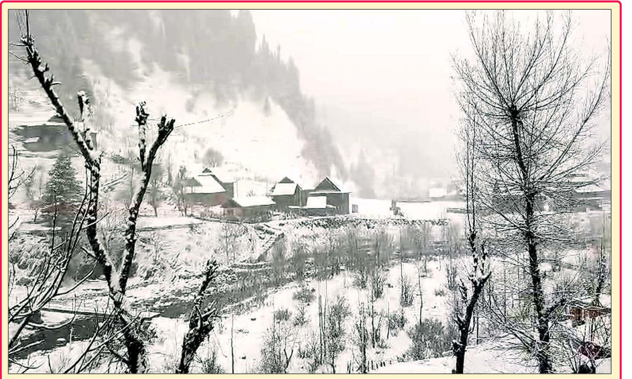
● ਕੁਪਵਾੜਾ ਵਿਖੇ ਤਾਜ਼ਾ ਬਰਫ਼ਬਾਰੀ ਦਾ ਦ੍ਰਿਸ਼।

ਬ੍ਰਿਸਬੇਨ, 8 ਦਸੰਬਰ (ਏਜੰਸੀ)- ਆਸਟ੍ਰੇਲੀਆ ਮਹਿਲਾ ਕ੍ਰਿਕਟ ਟੀਮ ਨੇ ਦੂਜੇ ਦਿਨ ਮੈਚ 'ਚ ਭਾਰਤ ਨੂੰ 122 ਦੌੜਾਂ ਨਾਲ ਹਰਾ ਦਿੱਤਾ ਹੈ। ਇਸ ਦਿਨ ਹੀ ਮੈਜ਼ਬਾਨ ਟੀਮ ਨੇ ਲੜੀ 'ਚ 2-0 ਨਾਲ ਜਿੱਤ ਦਰਜ ਕੀਤੀ। ਟਾਸ ਜਿੱਤ ਕੇ ਬੱਲੇਬਾਜ਼ੀ ਕਰਨ ਉੱਤੇ ਕੰਗਾਰੂ ਟੀਮ ਨੇ 8 ਵਿਕਟਾਂ ਗੁਆ ਕੇ 371 ਦੌੜਾਂ ਬਣਾਈਆਂ। ਜਵਾਬ 'ਚ ਭਾਰਤੀ ਟੀਮ 44.5 ਓਵਰ 'ਚ 249 ਦੌੜਾਂ 'ਤੇ ਸਿਮਟ ਗਈ। ਬ੍ਰਿਸਬੇਨ ਦੇ ਐਲਨ ਬਰਡਰ ਗਰਾਊਂਡ 'ਚ ਐਂਡਵਾਰ ਨੂੰ ਜੇਜ਼ੀਆ ਵੱਲ ਤੇ ਐਲਿਸ ਪੈਰੀ ਨੇ ਸੱਕੜੇ ਲਗਾਏ। ਵੋਲ ਨੇ 101 ਤੇ ਪੈਰੀ ਨੇ 105 ਦੌੜਾਂ ਦੀ ਪਾਰੀ ਖੇਡੀ। ਪੈਰੀ ਨੇ ਪਾਰੀ 'ਚ 6 ਫੰਕ ਲਗਾਏ। ਉਹ ਮਹਿਲਾ ਇਕ ਦਿਨ ਮੈਚਾਂ 'ਚ ਆਸਟ੍ਰੇਲੀਆ ਲਈ ਸਭ ਤੋਂ ਵੱਧ ਫੰਕ ਲਗਾਉਣ ਵਾਲੀ ਪਲੇਅਰ ਬਣੀ ਹੈ। ਹੁਣ ਉਨ੍ਹਾਂ ਦੇ 42 ਫੰਕ ਹੋ ਗਏ ਹਨ। ਇਸ ਤੋਂ ਪਹਿਲਾਂ ਇਹ ਰਿਕਾਰਡ ਮੈਗ ਲੈਨਿੰਗ (40 ਫੰਕ) ਦਾ ਨਾਅ ਸੀ। ਨਾਲ ਹੀ ਉਹ ਟੀਮ ਲਈ ਇਕ ਪਾਰੀ 'ਚ ਸਭ ਤੋਂ ਵੱਧ ਫੰਕ ਲਗਾਉਣ ਵਾਲੀ ਪਲੇਅਰ ਬਣ ਗਈ ਹੈ। ਭਾਰਤ ਲਈ ਰਿਚਾ ਘੋਸ਼ ਨੇ ਸਭ ਤੋਂ ਜ਼ਿਆਦਾ 54 ਦੌੜਾਂ ਬਣਾਈਆਂ। ਆਸਟ੍ਰੇਲੀਆ ਵਲੋਂ ਏਨਾਬੇਲ ਸਦਰਲੈਂਡ ਨੇ 4 ਵਿਕਟਾਂ ਲਈਆਂ।