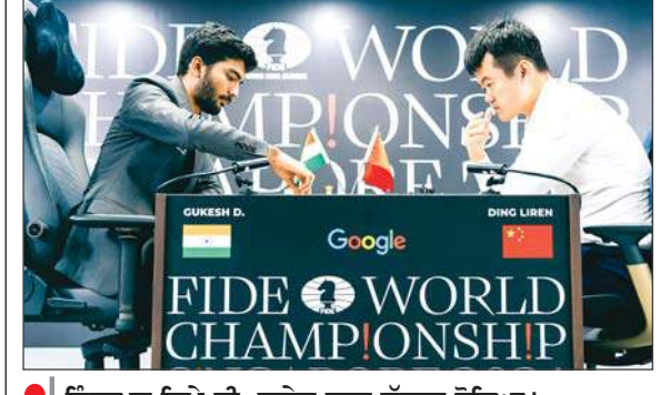
● ਸਿੰਗਾਪੁਰ ਵਿਖੇ ਡੀ. ਗੁਕੇਸ਼ ਚਾਲ ਚੱਲਦਾ ਹੋਇਆ।