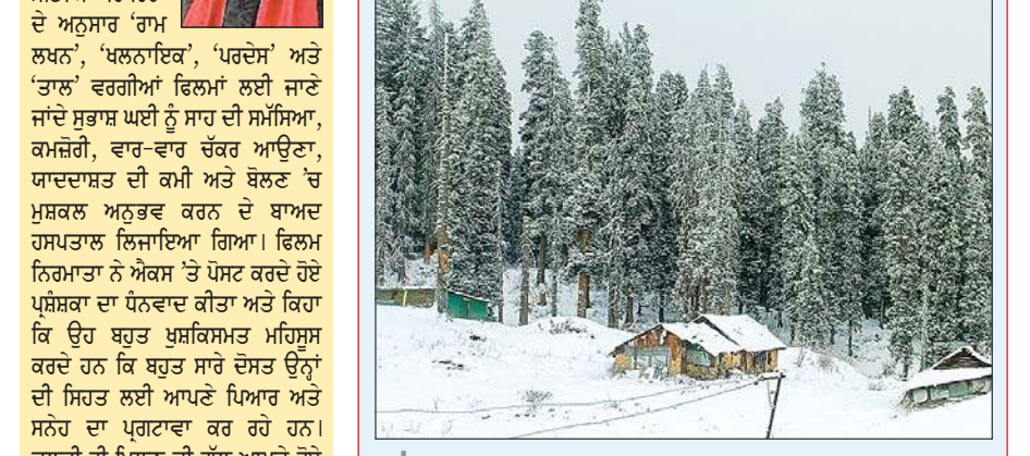
● ਬਾਰਾਮੂਲਾ ਦੇ ਤੰਗਮਾਰਗ ਵਿਖੇ ਬਰਫ਼ਬਾਰੀ ਦਾ ਮਨਮੋਹਕ ਦ੍ਰਿਸ਼।

ਮੁੰਬਈ, 8 ਦਸੰਬਰ (ਪੀ. ਟੀ. ਆਈ.)-ਫਿਲਮ ਨਿਰਮਾਤਾ ਸੁਭਾਸ਼ ਘਈ ਮੁੰਬਈ ਦੇ ਲੀਲਾਵਤੀ ਹਸਪਤਾਲ 'ਚ ਦਾਖ਼ਲ ਹਨ, ਜਿਥੇ ਉਨ੍ਹਾਂ ਦੀ ਹਾਲਤ ਠੀਕ ਹੈ। ਮੀਡੀਆ ਰਿਪੋਰਟਾਂ ਦੇ ਅਨੁਸਾਰ 'ਰਾਮ ਲਖਨ', 'ਖਲਨਾਇਕ', 'ਪਰਦੇਸ਼' ਅਤੇ 'ਤਾਲ' ਵਰਗੀਆਂ ਫਿਲਮਾਂ ਲਈ ਜਾਣੇ ਜਾਂਦੇ ਸੁਭਾਸ਼ ਘਈ ਨੂੰ ਸਾਹ ਦੀ ਸਮੱਸਿਆ, ਕਮਜ਼ੋਰੀ, ਵਾਰ-ਵਾਰ ਚੱਕਰ ਆਉਣਾ, ਯਾਦਦਾਸ਼ਤ ਦੀ ਕਮੀ ਅਤੇ ਬੋਲਣ 'ਚ ਮੁਸ਼ਕਲ ਅਨੁਭਵ ਕਰਨ ਦੇ ਬਾਅਦ ਹਸਪਤਾਲ ਲਿਆਇਆ ਗਿਆ। ਫਿਲਮ ਨਿਰਮਾਤਾ ਨੇ ਐਕਸ 'ਤੇ ਪੈਸਟ ਕਰਦੇ ਹੋਏ ਪ੍ਰਸ਼ੰਸਕਾ ਦਾ ਧੰਨਵਾਦ ਕੀਤਾ ਅਤੇ ਕਿਹਾ ਕਿ ਉਹ ਬਹੁਤ ਖੁਸ਼ਕਿਸਮਤ ਮਹਿਸੂਸ ਕਰਦੇ ਹਨ ਕਿ ਬਹੁਤ ਸਾਰੇ ਦੋਸਤ ਉਨ੍ਹਾਂ ਦੀ ਸਿਹਤ ਲਈ ਆਪਣੇ ਪਿਆਰ ਅਤੇ ਸਨੇਹ ਦਾ ਪ੍ਰਗਟਾਵਾ ਕਰ ਰਹੇ ਹਨ। ਜਲਦੀ ਹੀ ਮਿਲਣ ਦੀ ਗੱਲ ਆਖਦੇ ਹੋਏ ਉਨ੍ਹਾਂ ਕਿਹਾ ਕਿ ਸਭ ਠੀਕ ਹੈ।